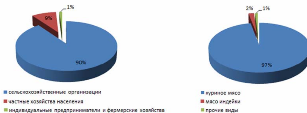
Рисунок 5. Структура производства мяса птицы в России в XXXX году

Таким образом, данная ситуация является весьма благоприятной и перспективной как для местных производителей и фермеров, так и для импортеров из дружественных стран.