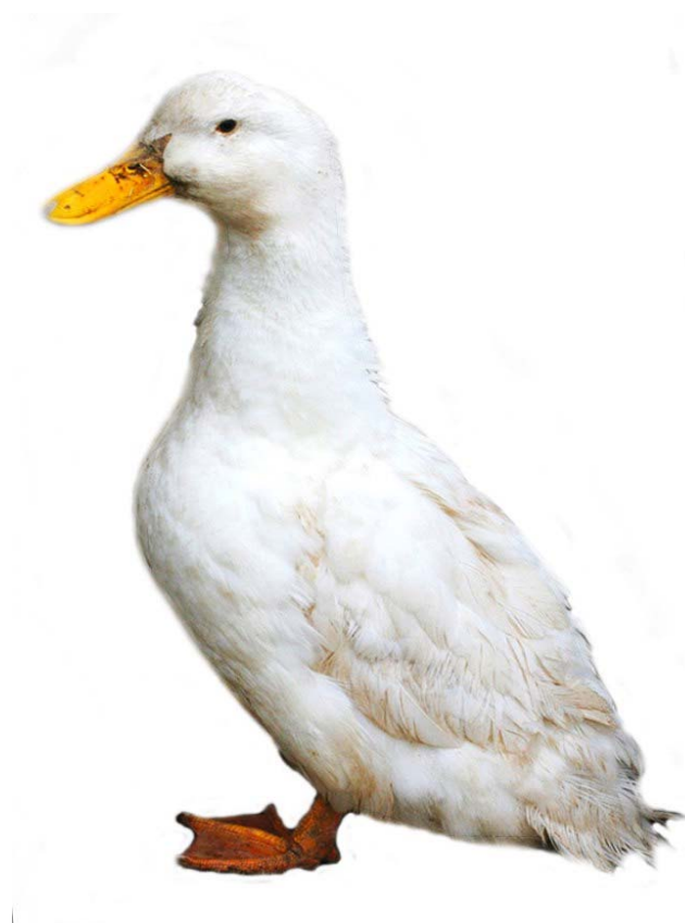
Рисунок 4. Внешний вид породы Черри Велли

Разведение утки Черри-Велли действительно выгодное, поскольку порода отличается очень высоким уровнем сохранности молодняка. Отметим, что до возраста в X недель доживает XX-XX% всех молодых особей, что является весьма неплохим показателем. Более того, сохранность взрослых особей еще выше: она составляет XX%.